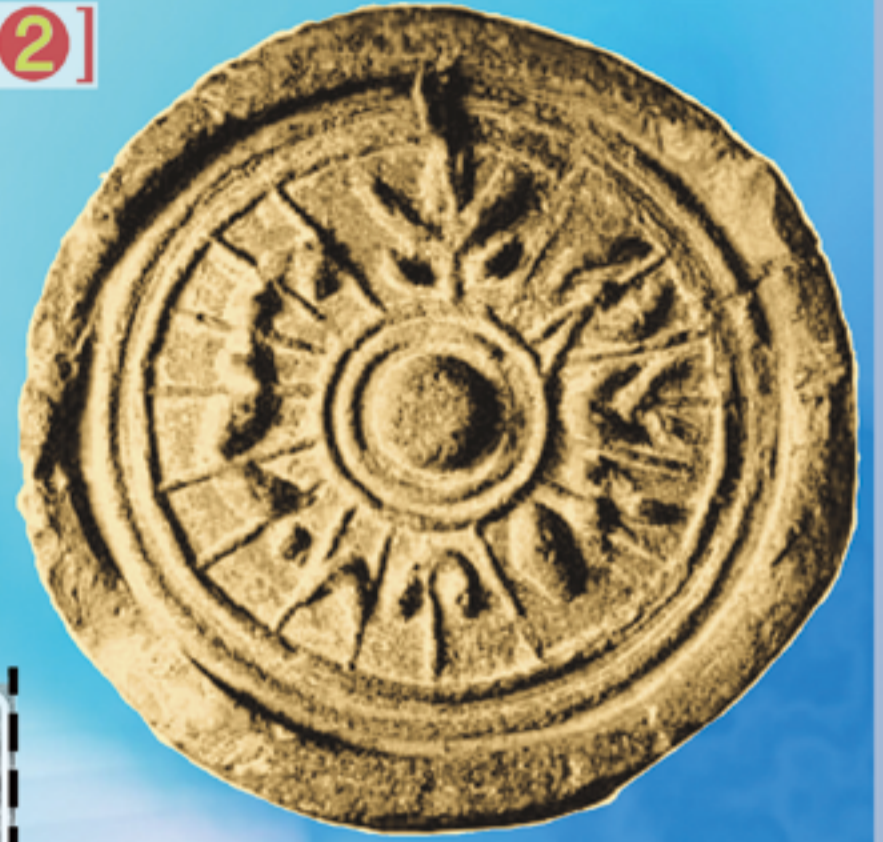
오염화(무궁화&근화문)수막새 출토지역: 평양 대동강 유역 (평천리 추정), 사헌출처: 『朝鮮古錢圖說』, 2권, 도194 동반(同圓)와당 소장처: 국립중앙박물관(유물번호_0484/구215), 경희대중앙박물관(유물번호_301429-000), 일본 메츠카야마 대학 부속 박물관 소장