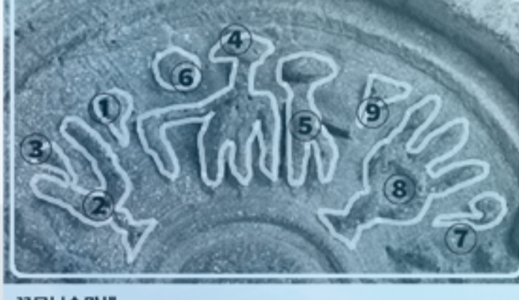
⑫⑪ ⑩ 𐤀 Amen 아멘 ANCIENT PHENICIAN. OLD HEBREW. OLD HEBREW. (BOOK INSCRIPTIONS.)

꽃무늬수막새 왼쪽의 문자 해석: 재사장이 그들(단지파 백성)을 보자 함께했다