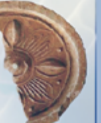
① 오염화(the five-leaves flower): 이따리가 다섯 갈래로 뻗어 있는 무궁화 (Rose of Sharon)를 상징