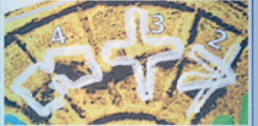
④③② 𐤀𐤋 selfsame 똑같은, of the Same Species 같은 종(種)의 Proto-Canaanite 𐤀𐤋