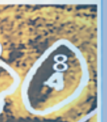
④③②① 𐤀𐤋 From cold 추위에서 Old Negev of Israel 𐤀𐤋