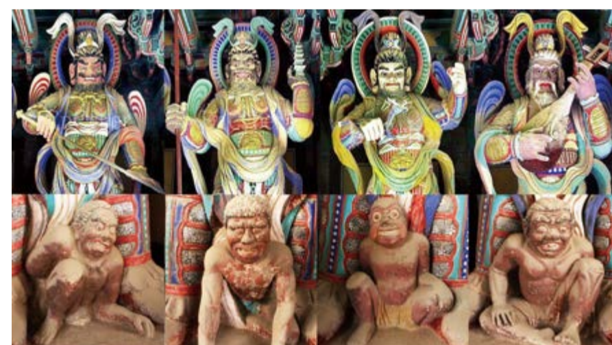
아상(我相) · 인상(人相) · 중생상(衆生相) · 수자상(壽者相)을 짓밟고 있는 불국사 천왕문의 사대천왕

何以故 須菩提 若菩薩 有我相 人相 衆生相 壽者相 卽非菩薩 하이고 수보리 약보살 유아상 인상 중