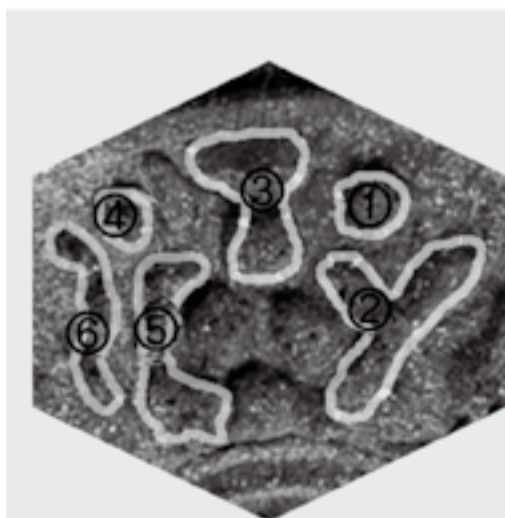
▲ 거꾸로 된 요나단의 얼굴을 바로 세운 모습

◀ 오각형 안의 그림 설명: 사람 형상을 한 문양이 <하나님>을 나타낸 것이라고 암시할 목적으로 'ⓧⓧⓧⓧⓧⓧⓧⓧⓧ: Yahh'라는 올드 네게브(Old Negev) 문자를 새겼다. 이 문자는 이스라엘 남부 네게브 산지 '하르 카르콤(Har Karkom)'에서 발견된 올드 네게브 문자(BC 1200년경)와 동일하다.