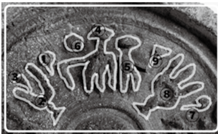
꽃무늬수막새 왼쪽의 문자 해석: 제사장 이그들(단지파 백성)을 보자 참깨였다