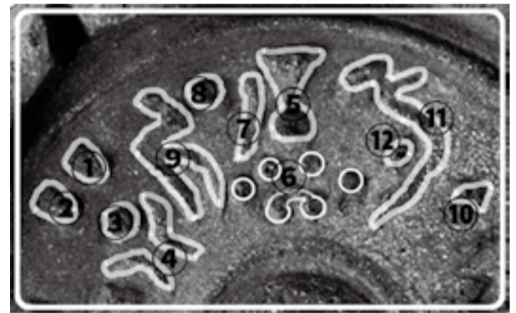
꽃무늬수막새 오른쪽의 문자 해석: 무장한 6백 명이 신당의 우상을 조롱하자 야훼께서 '야훼' 하고 응답하셨다