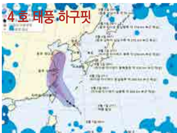
▲ 기상청 | 2020년 08월 02일 10시 00분 발표 제4호 태풍 하구핏(HAGUPIT) 예상 이동경로