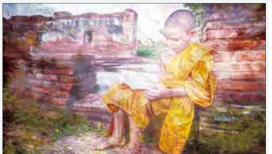
경을 암송하는 공덕

그래서 미륵부처님을 만나는 사람은 그 복과 덕이 이 세상의 무엇을 가지고 온갖 보시를 한 사람의 복과 덕보다 더 수승하다고 한 것이며, 더욱이 이 금강경의 사구