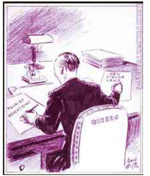
오손손이 하는 일을 원손이 모르게 하다 http://www.mcddev.mcgill.ca/ObjView/M965.199.3185.jpg

그런데 당시 박정희 대통령이 종교계의 대정부 직업을 한 적이 있었는데, 신총 종교에 관계가 있는 모씨가 전도관을 붕괴 시키려는 목적으로 전도관을 비방하는 내용들로 보고서를 작성하여 그것을 하필이면 일곱째 천사가 경영하는 복사기집에 복사를 하러 온 것이었습니다.