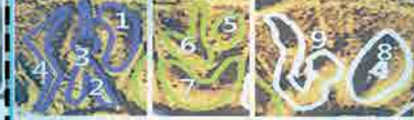
오엽화수막새 원문의 문자 해석: 추위로부터 어린 가지들 보호하라 Protect the sprigs from cold

④ 000 723 From cold 추위에서 Old Negev of Israel 7 723 000 Old Negev of the American SW 7 723 000 ⑦ 000 723 spring 봄가지, 어린 가지 Old Negev of the American SW 7 723 000 Old Negev of Israel 7 723 000 ⑧ 000 723 protect 보호하다 Proto-Canaanite 7 723 000 Old Negev of Israel 7 723 000