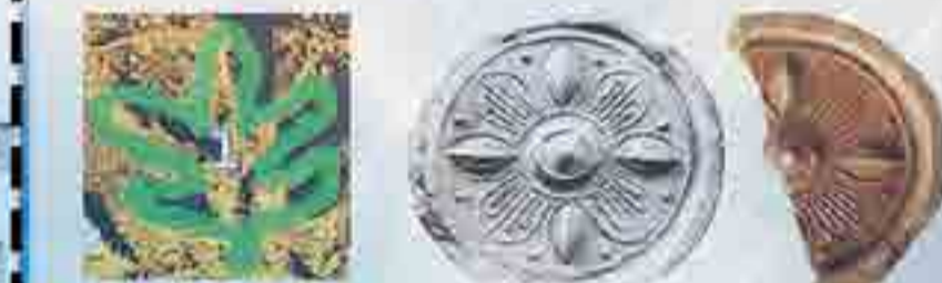
1) 오엽화(the five leaves flower) 원문의 문자 해석: 오엽화(무궁화)를 많이 생산시키자 Let's create lots of five-leaves flowers