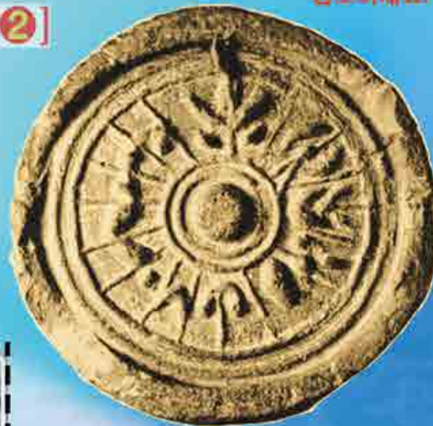
오엽화(무궁화)수막새 원문의 문자 해석: 오엽화(무궁화)를 많이 생산시키자 Let's create lots of five-leaves flowers