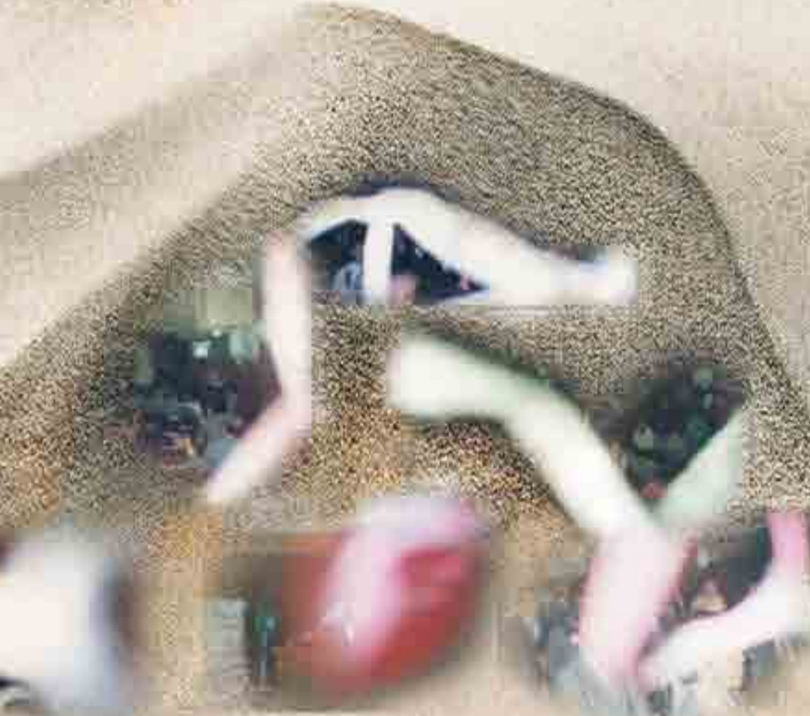
여호와와의 크고 두려운 날(말세末世)에 남종과 여종들에게 은혜를 부어주리니 피와 불과 연기 기둥이라 『요엘서 2장 28~31절』

5. 영생의 확신과 소망이 있는 자는 마음이 편안하기에 늘 웃게 되어 있다. 이렇게 웃는 마음으로 가득찬 생활을 하게 되면 하나님이 되어 영생할 수밖에 없다고 한다. 웃는 사람들이 많아질수록 웃는 사람의 몸에서 공기를 맑히는 물질이 마구 쏟아져 나와 코로나19와 같은 괴질을 깨끗이 청소할 수 있는 것이다.