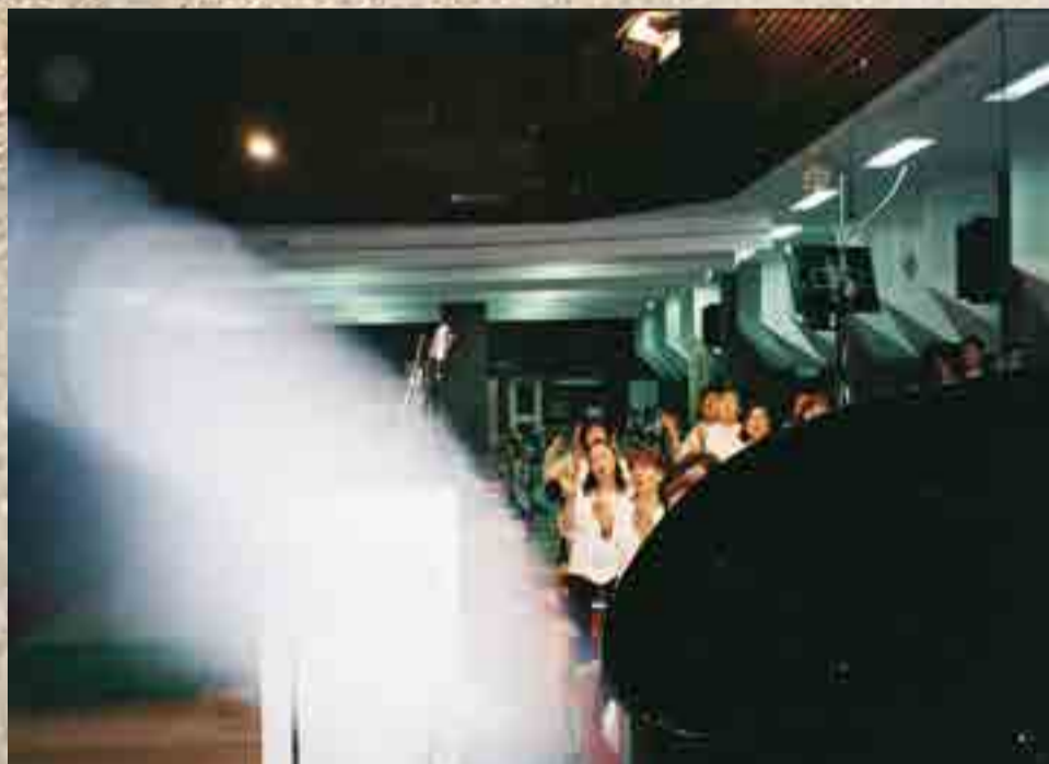
보광절 1부 예배시 무궁화합창단에 내린 감로이슬성신(2019. 06. 19. 촬영)