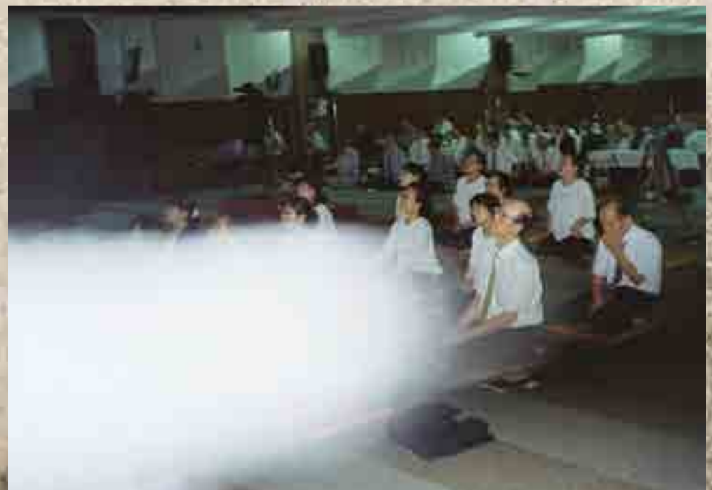
성탄절 예배시 합창단에 내린 감로이슬성신(2019. 08. 12. 촬영)