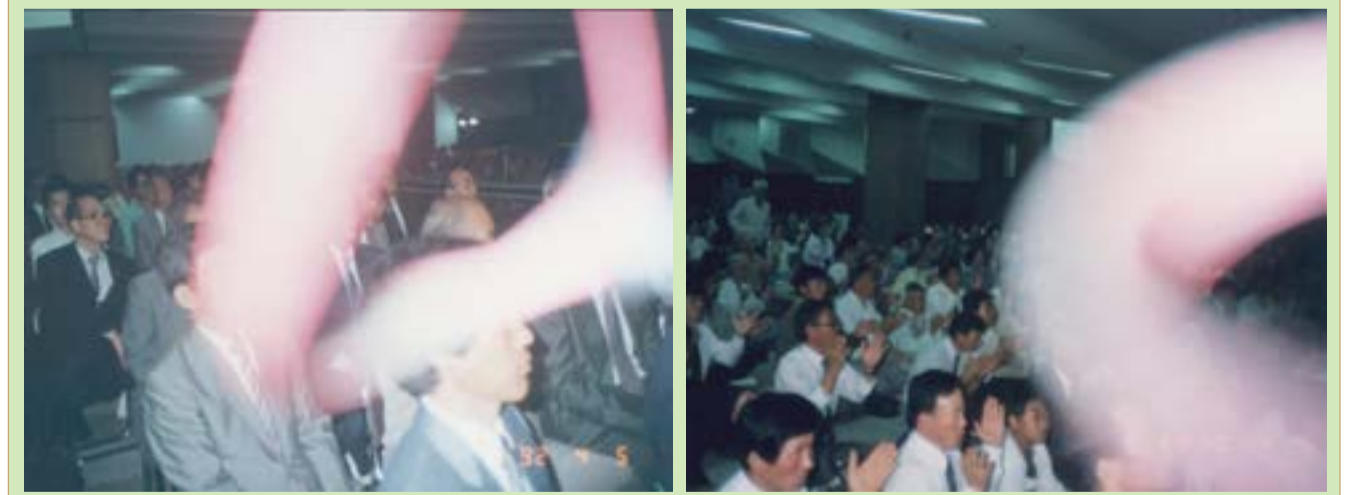
△ I will be as the dew to Israel: he shall blossom as the lily _ Hosea 14:5 내가 이스라엘에게 이슬과 같으리니 저가 백합화 같이 피겠고 _ 호세아 14장 5절