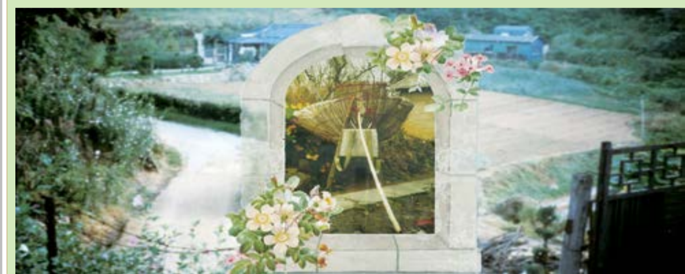
Korean A-frame loaded with three bags of rice 쌀 세 가마를 실은 지게