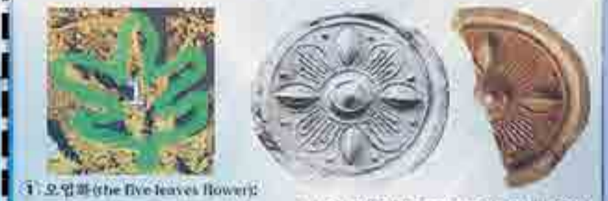
오염화(the five-leaves flower): 5개의 잎을 이리저리 새긴 무궁화수막새 (고조선) 출토지: 평양 대동강 유역, 서울특별시 - 서울로 127

오염화수막새 원쪽의 문자 해석: 오염화를 많이 생산시키자 Let's create lots of five-leaves flowers