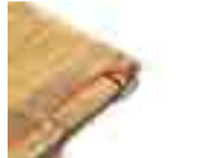
적암유록 新해설 수정판 제3회

다. 양 손으로 발목을 잡는다. 숨을 내쉬고 마시고 반복한다. 10초 유지, 5회. 동작④: 숨을 마시고 내쉬며 엉덩이를 최대한 들어 올린다. 발바닥은 바닥에 밀착시키고 손으로 뒤꿈치를 잡는다. 허벅지 힘으로 유지한다. 10초 유지, 5회.*