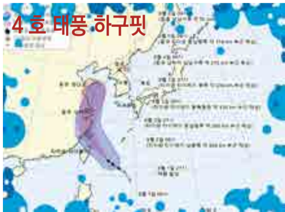
▲ 기상청 | 2020년 08월 02일 10시 00분 발표 제4호 태풍 하구핏(HAGUPIT) 예상 이동경로