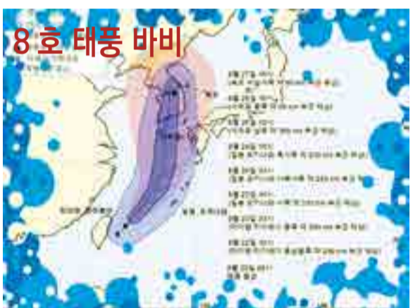
▲ 기상청 | 2020년 08월 22일 16시 00분 발표 제8호 태풍 바비(BAVI) 예상 이동경로