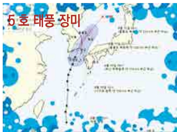
▲ 기상청 | 2020년 08월 10일 13시 00분 발표 제5호 태풍 장미(JANGMI) 예상 이동경로