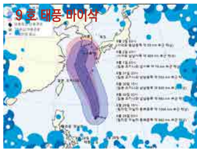
▲ 기상청 | 2020년 08월 29일 04시 00분 발표 제9호 태풍 마이삭(MAYSAK) 예상 이동경로