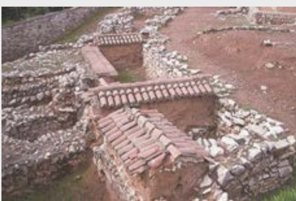
레르나(Lerna)에서 발굴된 담장 위에 얹어놓은 고대 S자형 기와

이스라엘 민족의 제사장 직분을 담당했던 레위지파의 사람들이 도파성이라는 구별된 성읍을 차지하고 살았던 것처럼, 한반도에 도착한 이스라엘 단지파 민족도 천제를 지내는 곳에 제사장들만 살게 하고 일반 사람의 출입을 금하였던 것으로 보인다. 이런 풍습이 후대에 전해져 삼한