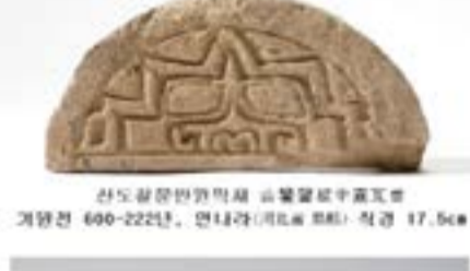
중국 최초의 기와는 주(周)나라 말 연(燕)의 하도(下都)인 역현(易縣) 또는 제(齊)의 국도인 임치(臨淄) 등에서 출토된 예가 있으나 이곳에서는 반원형의 와당을 포함한 많은 기와의 발견이 보고되었다. [출처: 한국민족문화대백과사전(와당(瓦當))] *