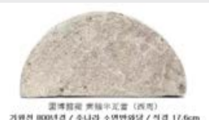
중국 최초의 기와는 주(周)나라 말 연(燕)의 하도(下都)인 역현(易縣) 또는 제(齊)의 국도인 임치(臨淄) 등에서 출토된 예가 있으나 이곳에서는 반원형의 와당을 포함한 많은 기와의 발견이 보고되었다. *