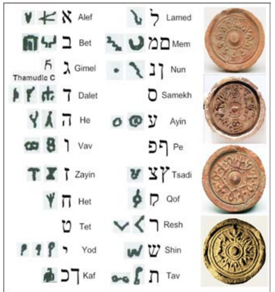
고조선 건국 초기에 제작된 4점의 와당에는 고대 히브리어가 새겨져 있는데, 고대 가나안 텔 라기스(Tel Lakhish) 사원에서 발견된 올드네게브(Old Negev) 문자에 새겨진 올드네게브 문자(고대 히브리어)와 일치한다. 고고학적인 유물의 연대 측정결과 기원전 1220년경의 물단지로 확인되었다.

오늘날 대한민국의 집 대문기둥에 무궁화 와당으로 장식된 것은 영생하는 무극시대를 곧 맞이한다는 뜻이다.*