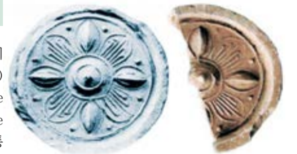
무궁화 꽃잎이 다섯 개로 이루어진 특징을 표현

leaves flower)이 '무궁화'라고 추정할 수 있는 근거는 동일한 시대(고조선 시대), 동일한 장소(대동강 유역)에서 출토된 무궁화 와당이다. 무궁화(Rose of Sharon)의 학술명이 <Hibiscus Syriacus L.>로서 이 꽃의 원산지가 레바논과 시리아 근처이다. 이러한 점은 한반도 대동강 유역에 고조선을 세운 한민족이 지중해 연안에서 이주해온 단지파 민족이라는 사실을 입증해준다.*