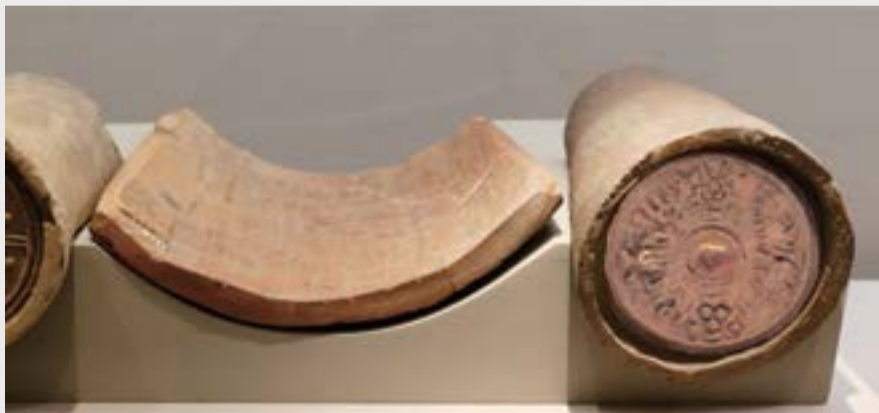
고조선 시대에 제작된 암키와 & 원형와당(圓形瓦當) 직경 17.4cm, 국립중앙박물관 이우치이사오 기증실

허용하였다. 그래서 고조선에서 중국 주(周)나라에 처음으로 전래된 와당은 반와당이었다. 마찬가지로 반와당은 중국 춘추시대에 고조선과 국경을 마주하는 연라로 전래되고 또한 고조선의 황해(黃海) 건너편에 있는 제(齊)나라에도 전래되었다.