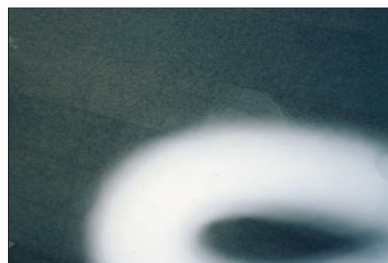
본부제단에서 내린 이슬성신

본지 지난호는 승리제단 홈페이지 http://www.victor.or.kr 에서 볼 수 있습니다.