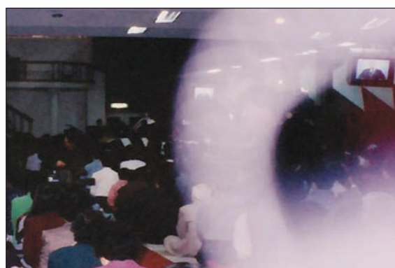
본부제단에서 내린 이슬성신