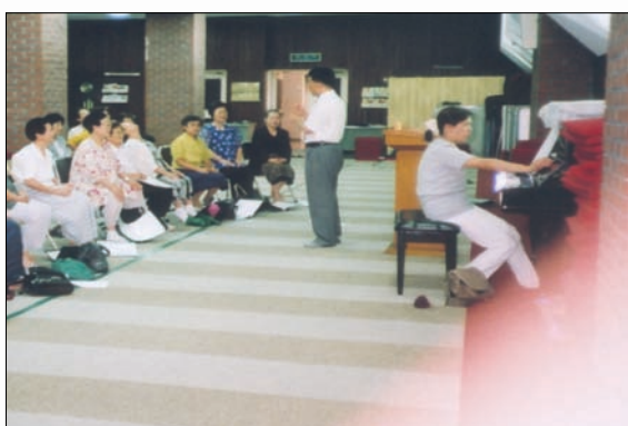
본부제단에서 내린 이슬성신