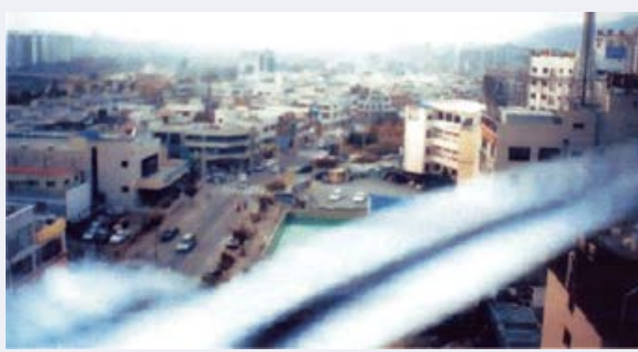
위 사진 속 두 줄기의 환구름처럼 보이는 부분은 만사지 정도령의 증표인 <감로해인>인데 이 감로해인(아마로)이 개벽기에 만민을 살릴 <의통>이다. (청주승리제단 건물로부터 분출하고 있다)

1 시천주주(侍天主呢)는 至氣今至願爲大降 侍天主造化定 永世不忘萬事知(자기금지원위대강 시천주조화정 영세불망만사지)의 21자이다. 이는 '하늘의 지극한 기운이 내게 이르렀으니 하늘님을 모신 나는 스스로 조화를 정하여 평생 잊지 않고 하늘의 도에 맞도록 행하겠습니다.'라고 알고 있지만 하나님의 신이 임하시면 모든 것을 통달하여 알게 된다는 뜻이다.