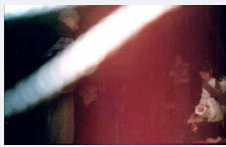
무량대수의 회전속도로 회오리치는 모양새로 우주와 인생들과 만물을 뒹고 들어오는 구원의 영, 하나님의 감로 이슬성신

천도교에서는 시천주주의 '영세불망만사지'를 '그 덕을 받고 받게 하여 늘 생각하며 잊지 아니하면 지기에 화하여 지극한 성인에 이르느니라' 라고 불분명하게 풀이한다. 또 증산도에서는 '공자, 석가, 예수는 내가 쓰기 위해 내려보냈다(도전2:40:5)'라는 미완성자의 방편의 말을 그대로 믿고 자신들의 종교관을 정당화하며 미신타파(迷信打破)라는 명목(名目)으로 단군상의 목을 자르는 조상도 모르는 패륜행위(悖倫行爲)를 저지르는 기독교의 실상을 제대로 파악하지 못하고 있다.