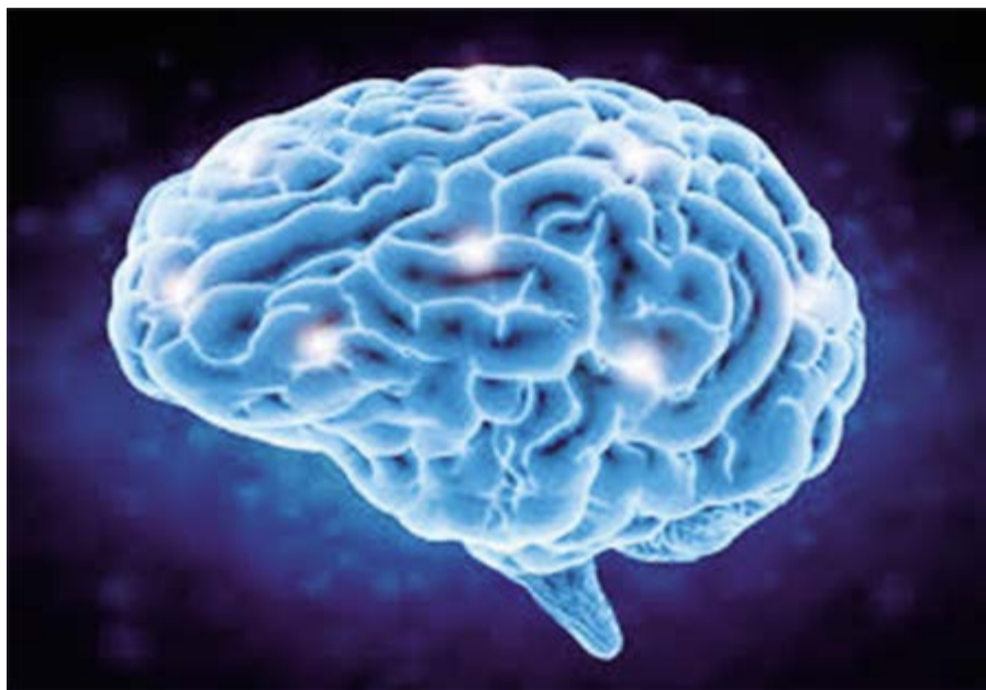
마음이 뇌에 있다면 뇌에서 벗어나 뇌를 의식할 수 있는 이유는 무엇인가

필자가 대학 다닐 때 어떤 구도단체를 찾아간 적이 있다. 거기에 있는 분이 이렇게 물어봤다. "제가 지금 불편한 자루를 들고 있습니다. 여러분! 이 불편이 보이죠. 그렇다면 여러분의 어떤 것이 이 불편을 보고 있는 것입니까?" 어떤 분이 "눈이 봅니다"라고 답했다. 그러자 "만일 당신의 눈을 뽑아서 불편 앞에 놓으면 볼 수 있습니까?"라고 묻는다. "없습니다"라고 답하자 "그러면 어떤 것이 보는 것입니까?"라고 재차 묻는다. 그러자 "머리가 본다, 마음이 본다, 몸이 본다" 등등의 답이 나왔다. 질문자는 만일 이에 대한 답을 즉각 안다면 그 사람은 깨달은 사람이라는 것이었다. 또 "만일 이곳에 방금 죽은 시체가 있다고 하자, 그러면 그 시체는 눈도 뇌도 아직 완전히 썩지 않았는데 그 시체는 이 불편을 볼 수 있습니까?"라고 묻는다. "못 봅니다." 그렇다면 과연 보는 존재는 어떤 것인가? 이에 대한 답은 당신의 인생을 송두리째 바꿀 수 있는 엄청난 것일지도 모른다.