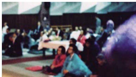
2018 승리절 경축행사에서 내린 이슬성신 (우측 광선)