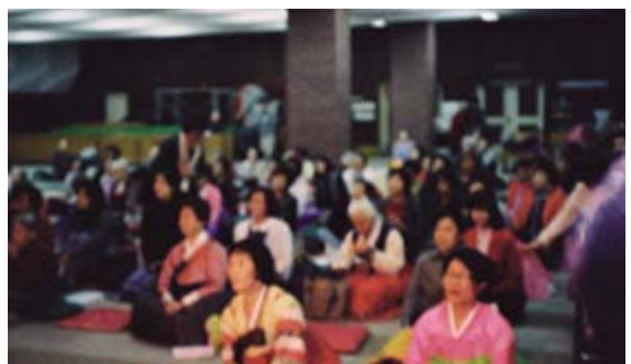
2018 승리절 경축행사에서 내린 이슬성신 (우측 광선)

이슬성신은 삼위일체 하나님의 신(호 14:5)이라 빛의 형상(요한복음 1장)으로 나타난다. 영안이 열린 사람은 이슬성신을 볼 수 있지만 죄인의 눈에는 안 보인다. 대신 죄가 없는 카메라 렌즈에는 찍히는 것이다.