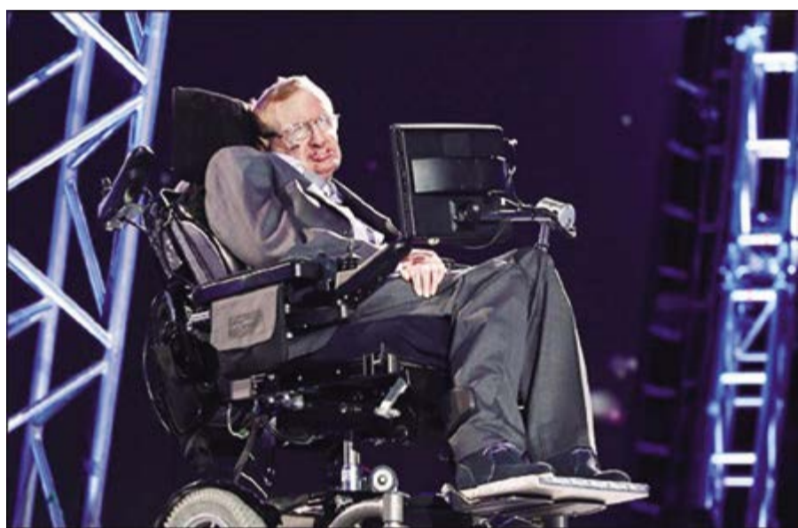
신이 없다고 말한 호킹

조희성 구세주의 말씀에 따르면 신에는 두 종류가 있다. 즉 하나님의 신과 마귀의 신이다. 하나님의 신은 생명의 신이고, 반면 마귀의 신은 사탄의 신이다. 두 신은 철천지원수처럼 서로를 죽이고 싸워왔다. 그래서 인류 역사는 바로 하나님의 신과 마귀의 신과의 투쟁의 역사라고 해도 과언이 아니다. 왜냐하면 인류의 출현이 하나님의 신이 마