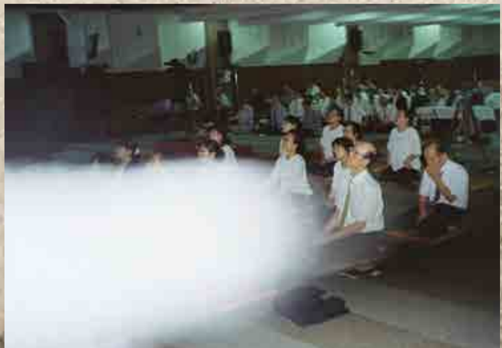
성탄절 예배시 합창단에 내린 감로이슬성신(2019. 08. 12. 촬영)