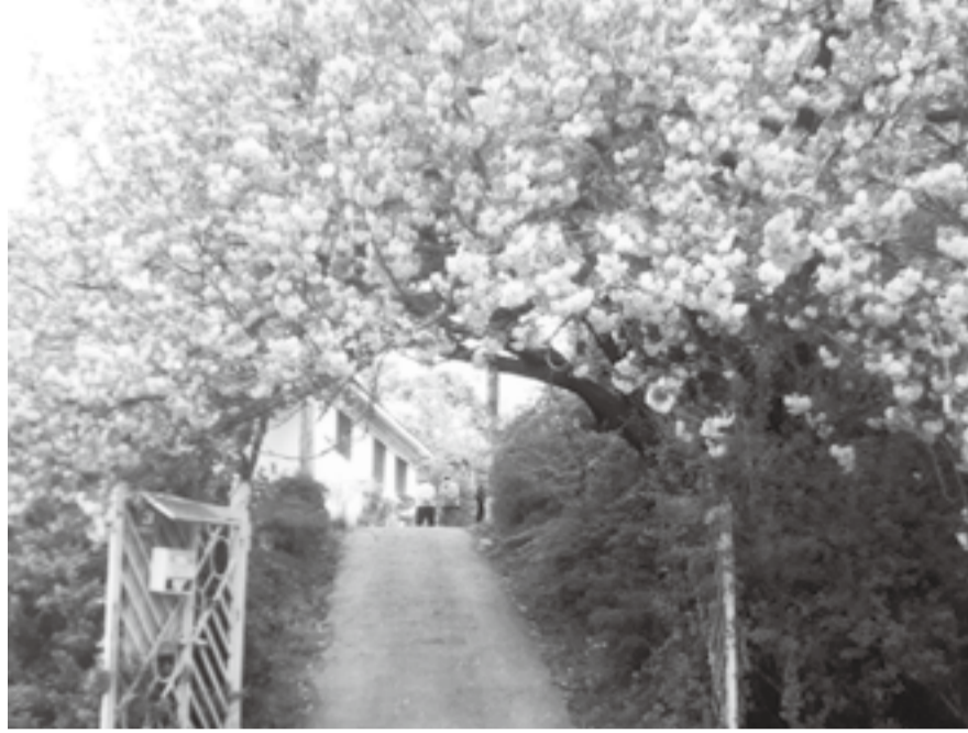
삼위일체 하나님을 석방시켜 모체에 숨겨냈다고 한 영모님. 모체는 바로 밀실(위 사진)이다

이지 않는 하늘에 있는 하나님이 아닌 사람 몸을 입고 인간과 똑같은 모습을 한 하나님을 알리고 계신 것이다.