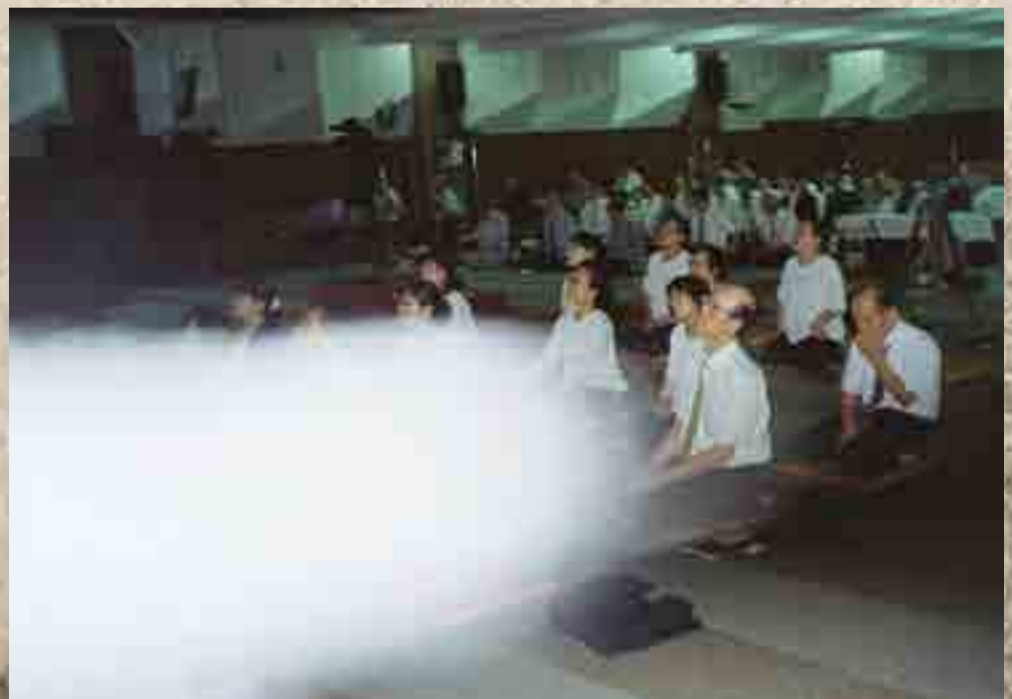
성탄절 예배시 합창단에 내린 감로이슬성신(2019. 08. 12. 촬영)