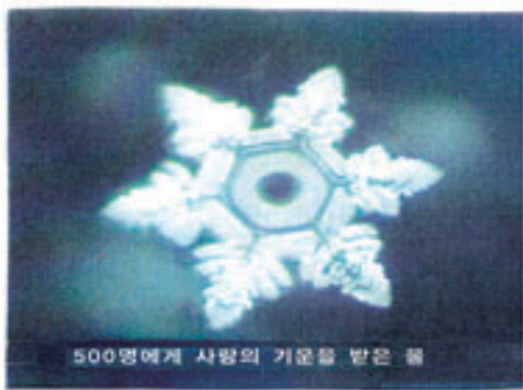
일본 각지에 흩어져 있는 500명이 동시에 물에 사랑의 기도를 보냈습니다. 그러자 수돗물이 어떤 결정으로 바뀌었습니까. 사랑의 마음은 한 순간에 아름다운 형태를 수 있습니다.

물과 세계를 향해 기도를 올리면 물 결정은 극적으로 모습을 바꿨다. 그런 실험을 보았습니까.