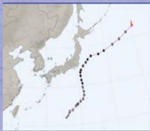
제7호 태풍 암필(AMPIL)

피해를 주지 않은 태풍: 제6호 태풍 손뎌는 베트남에서 제출한 이름으로 신화속의 산신(山神, 정령)으로서 홍수와 폭풍 등의 자연재해를 극복하려는 열망과 능력을 상징한다. 제7호 태풍 암필은 캄보디아에서 제출한 이름으로 타마린드(공과의 상록 교목)를 의미한다. 제8호 태풍 우콩은 중국에서 제출한 이름으로 손오공을 의미한다. 제12호 태풍 리피는 라오스에서 제출한 이름으로 폭포를 의미한다.