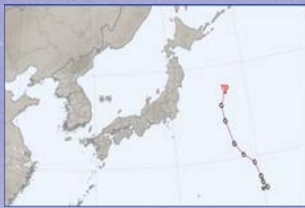
제8호 태풍 우콩(WUKONG)

피해를 주지 않은 태풍: 제6호 태풍 손뎌는 베트남에서 제출한 이름으로 신화속의 산신(山神, 정령)으로서 홍수와 폭풍 등의 자연재해를 극복하려는 열망과 능력을 상징한다. 제7호 태풍 암필은 캄보디아에서 제출한 이름으로 타마린드(공과의 상록 교목)를 의미한다. 제8호 태풍 우콩은 중국에서 제출한 이름으로 손오공을 의미한다. 제12호 태풍 리피는 라오스에서 제출한 이름으로 폭포를 의미한다.