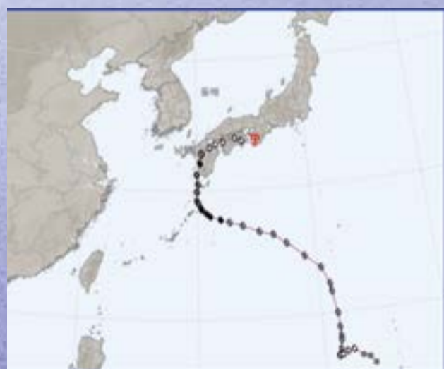
제10호 태풍 산산(SHANSHAN)

태풍 종다리(JONGDARI)는 북한에서 제출한 이름으로 종달새를 뜻한다. 2020년 태풍 바비 이후 4년 만에 한국 서해를 횡단했다. 태풍 종다리의 영향으로 광주-전남에 하루 동안 1,300차례 넘는 번개가 친 것으로 나타났다. 수도권에서도 밤사이 낙뢰를 동반한 강한 비를 뿌렸다.