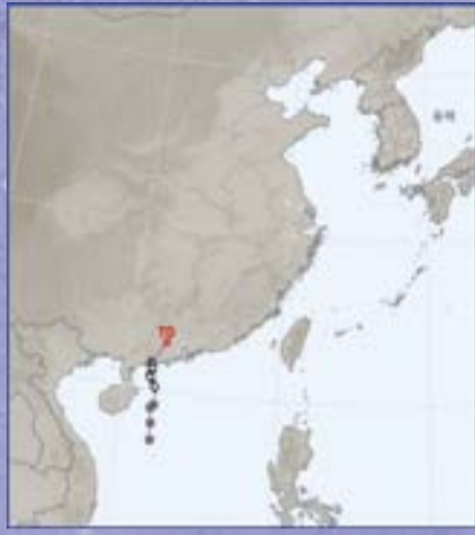
제2호 태풍 말릭시(MALIKSI)

제2호 태풍 말릭시(MALIKSI)는 5월 31일 15시에 중국 홍콩 남서쪽 약 310km 부근 해상(남중국해)에서 발생하였다. 6월 1일 12시에 중국 광둥성 양장시에 상륙한지 4시간 만에 소멸되었다. 말릭시는 필리핀이 제안한 이름으로 "빠르다"는 의미를 가지고 있는데, 이름 그대로 23시간 30분동안 생존하고 매우 빠르게 생을 마감하였다.