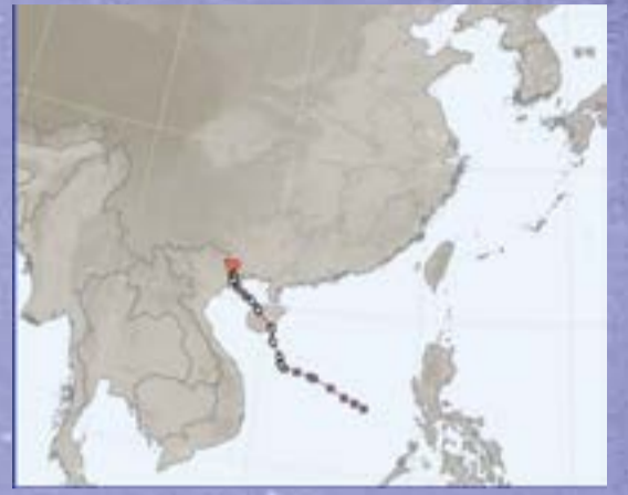
제4호 태풍 프라피룬(PRAPIROON)

대만을 관통한 태풍 개미가 중국 남부 후난성에 상륙하면서 7월 26일부터 30일까지 일 평균 410mm, 최대 645mm의 폭우가 쏟아졌다. 후난성 쑹싱(資興)시는 11만 8천여명의 이재민이 발생했으며 긴급대피한 주민은 약 2만명에 달했다.