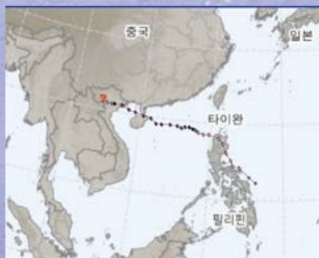
제11호 태풍 야기(YAGI)

제10호 태풍 산산은 8월 29일 8시에 일본 규슈 남부 가고시마현에 상륙하였다. 태풍이 상륙하기 전날에 가고시마현, 미야자키현, 구마모토현에서는 전날 주민 225만 명을 상대로 피난 지시가 내려졌다. 일본 기상청은 지난 2022년 9월 일본에 영향을 줬던 태풍 난마돌 이후 2년 만에 태풍 특별경보를 발령했다. 규슈와 시코쿠를 오가는 항공편 480여 편이 결항했다. 규슈 전역에서 16만 8천 가구가 정전되었다. 규슈 남동부 미야자키현에서는 30일 오전 8시까지 72시간 동안 884mm의 비가 쏟아졌는데, 이는 8월 한 달 치 평균 강우량의 1.5배에 이르는 양이었다. 고속도로와 철도 등 교통도 마비되자 도쿄역은 29일 오후 11시쯤에 정차 중인 신칸센 열차를 일부 승객에게 개방해 임시 숙소처럼 쓰도록 했다. 산산은 일본 규슈에 상륙한 뒤에 시코쿠, 주고쿠를 지나 오사카가 있는 간사이 그리고 혼슈의 중부까지 영향을 끼쳤다.