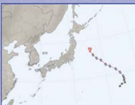
제6호 태풍 손뎌(SON-TINH)

8월 8일 일본 미야자키현 앞바다에서 규모 7.1 지진에 이어 9일 토고 인근 가나카와 현에서 규모 5.3 지진 그리고 10일 홋카이도 아사히카와시 해역에 규모 6.8 지진 등 3연속 강진 직후 태풍 마리아 상륙 예보로 일본인들의 생필품 사재기가 극성을 이루었다. 태풍 마리아가 8월 12일 도호쿠 지방을 관통하면서 기록적인 폭우를 내림으로써 이곳 항공기와 철도 운행을 중단했다.