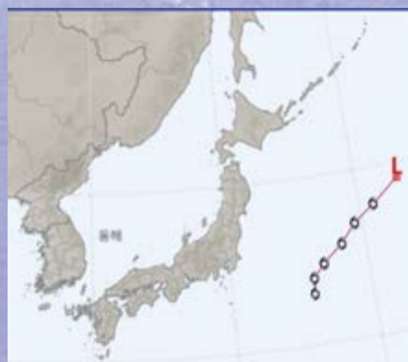
제12호 태풍 리피(LEEPI)

9월 6일 중국 남부 하이난 섬에 상륙한 제11호 태풍 야기로 인하여 하이난 섬 내 주택 2만 5천채가 파손됐고, 이재민 120만명이 발생했다. 하이난성 하이커우시에서는 경제적 손실이 263억 2400만 위안(약 4조 9500억 원)에 달했다. 베트남 재난 당국은 30년 만의 최악 태풍으로 기록된 태풍 야기(9월 7일 베트남 북동부를 강타)에 의한 홍수와 산사태로 291명이 사망하고 38명이 실종됐다고 밝혔으며, 다리가 무너지고 버스가 급류에 휘말리는 등 주택 23만5천채가 파손됐고 피해 농경지는 30만ha가 넘었다. 미얀마 군정은 태풍 야기에 의한 피해가 커지자 이례적으로 외국에 지원을 요청하기도 했으며, 유엔 인도주의업무조정국(OCHA)은 미얀마 전역에서 약 63만1천명이 홍수 피해를 본 것으로 추정된다고 밝혔다. 미얀마 국영 신문 글로벌 뉴라이프에 따르면, 15만 채 이상의 주택이 침수됐다.