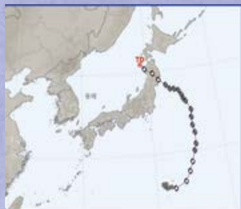
제5호 태풍 마리아(MARIA)

올해 4번째 태풍 프라피룬 호가 7월22일 오전 1시 30분 (현지시간)에 중국 남부 섬 하이난성에 상륙했다. 이어서 7월 23일 9시에 베트남 북부 평민성에 상륙하면서 고도 섬에서는 수백 그루의 나무가 쓰러지고 관광객과 주민 3,800여 명이 발이 묶였다. 폭우에 의한 산사태와 홍수로 16명이 사망했다.