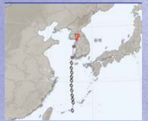
제9호 태풍 종다리(JONGDARI)

태풍 종다리(JONGDARI)는 북한에서 제출한 이름으로 종달새를 뜻한다. 2020년 태풍 바비 이후 4년 만에 한국 서해를 횡단했다. 태풍 종다리의 영향으로 광주-전남에 하루 동안 1,300차례 넘는 번개가 친 것으로 나타났다. 수도권에서도 밤사이 낙뢰를 동반한 강한 비를 뿌렸다.