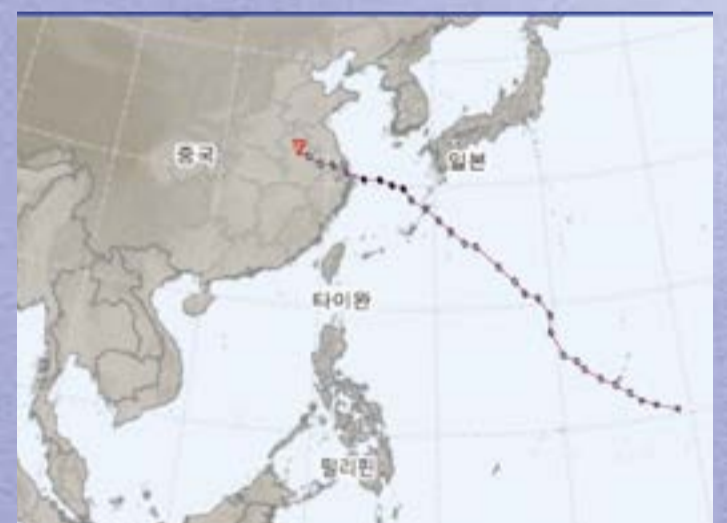
제13호 태풍 버빙카(BEBINCA)

제13호 태풍 버빙카는 9월 16일 9시에 중국 상하이에 상륙하면서 강한 바람과 폭우를 동반했다. 1949년 태풍 글로리아 이후 75년 동안 상하이에 상륙한 태풍 중 가장 강력한 것이었다. 상하이에서 대피한 인원은 41만 4000명에 달하며 6만 명이 넘는 응급구조대원과 소방대원이 대비하였다. 16일 12시 30분 현재 상하이 시내에서 건물 4채가 파손되고 1만 그루 이상의 나무가 쓰러지거나 부러지는 피해가 발생했다고 한다. 상하이 공항에서는 여객기 수백편의 운항을 취소했고 여객선, 열차 등 각종 교통수단이 중단되었다.