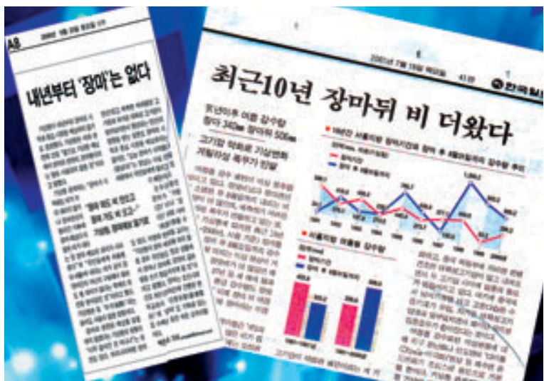
조선일보 2009년 8월 23일자 보도 내용

장마란 6.15.경부터 7.15.경까지 지속적으로 오는 비를 말한다. 장마기간은 풍년과 밀접한 관련이 있다. 대개 장마기간은 모내기 후 벼가 뿌리를 완전히 내리고 성장하기 시작하는 시기인데 이때 장마가 지면 모가 다 죽게 되어 흉년이 들게 된다.