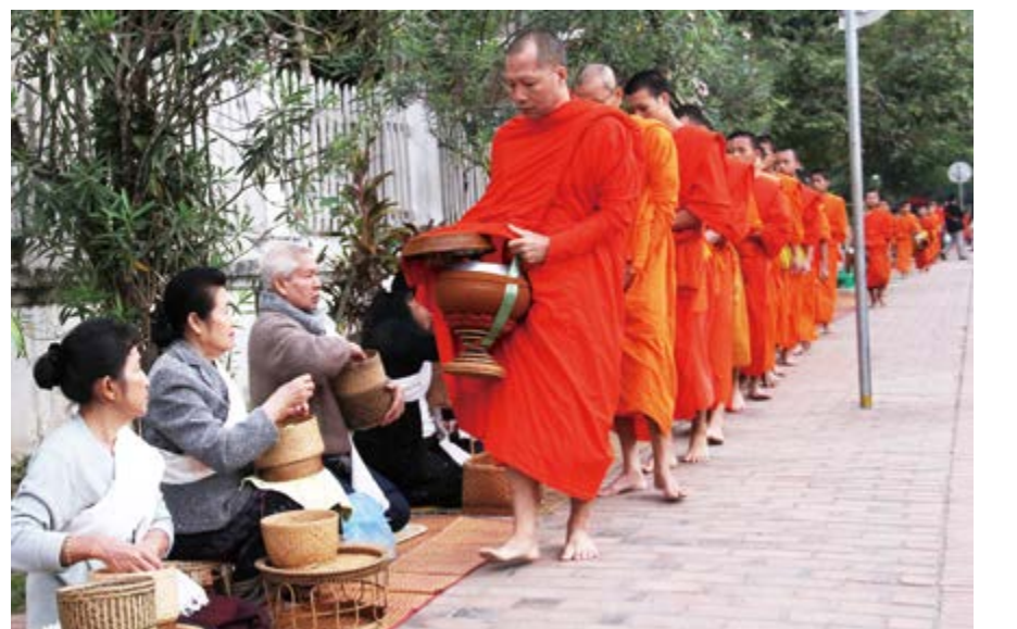
라오스 루앙프라방(Luang Prabang)의 이른 새벽에 스님들이 탁발하는 모습

이 말씀들은 "모든 만물이 불성(佛性)이 있다"라고 하는 대의에 평등함을 밝혔는데 대승의 논지이자 불교의 핵심인 일체중생실유불성(一切衆生悉有佛性; 만물이 불성이 되는 생명이 있다)이라고 하는 큰 진리(眞理) 아래 생명의 존엄성에 큰 뜻을 갖추고 있는 불교의 가르침에서 차별의 상이 없는 평등함을 말하고 있다. 즉 너와 내가 다름이 아니고 "우주의 만물에 불성이 있다."라고 하는 것은 바로 누구나 부처요 중생들의 번뇌(煩惱)가 없어지면 불성을 회복하여 부처가 된다고 하는데 여기에는 도덕질한 사람이나, 살인 죄를 저지른 사람이나 불법(佛法)을 비방하는 일천제(一闍提)의 무리들도 불성이 있다고 하였으니 이는 바로 평등