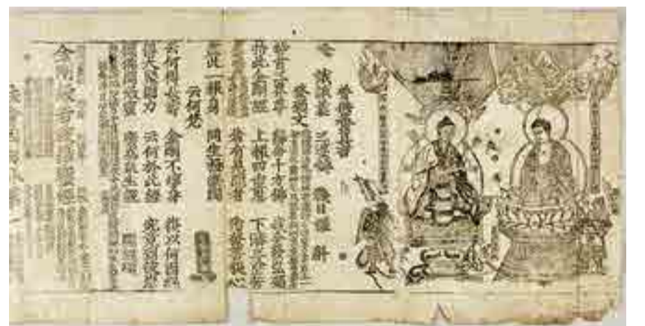
보물 제87호 금강반야바라밀경(金剛般若波羅蜜經)

"석존께서는 31세(歲)에 응화(應化)하여 화엄과 아함부를 같은 때에 말씀하였다."라고 기록되어 있다.