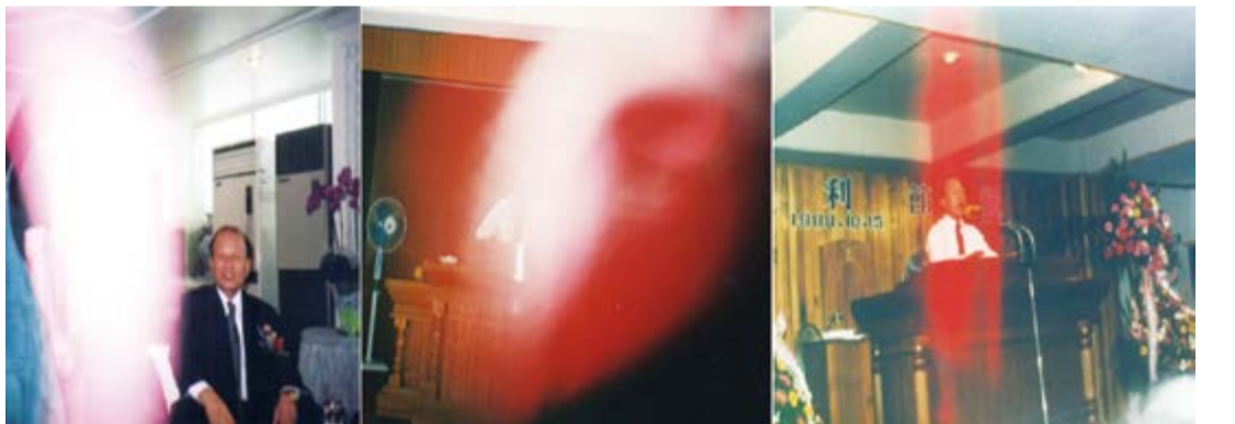
부처님의 32상 가운데 몸에서 솟는 밝은 빛(감로광명)이 촬영된 사진

해설) 위의 말씀의 뜻은 미륵부처님께서 인간의 몸을 입고 법을 설하시는 데 세상 사람들이 보기에 진지를 드시고 잠을 주무시고 각 지방과 해외제단을 순회 방문 시(時)에 자동차의 비행기를 이용하시니, 사람이 아니냐고 하지만 겉모습은 사람같이 보이지만 사람의 모습으로 오신 조금도 빈틈이 없으신 완벽한 부처님이라고 알려주는 장면입니다. 사실 초창기에는 승리제단에서 법문