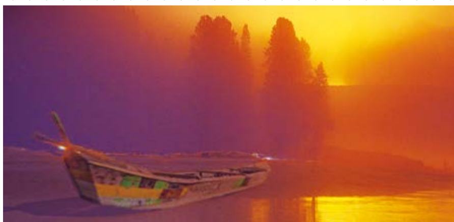
이 언덕에서 저 언덕(彼岸), 구경열반(究竟涅槃)의 경지

수보리야, 너의 생각에는 어떻게냐? 여래(석존)가 아누다라삼막삼보리(무상정등각)를 얻었다고 여기느냐? 여래(석존)가 법을 말한 바가 있다고 여기느냐? 須菩提言 如我 解佛所說義無 有定法名阿耨