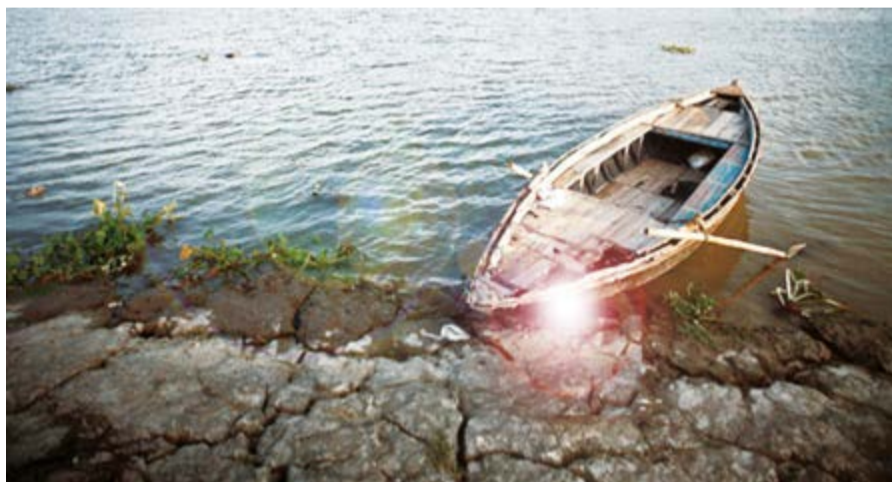
피안의 언덕에 닿으면 뗏목을 버려라

迦葉菩薩言 世尊如文殊等 誼有幾人能了是義 惟願如來便爲大衆廣分別說 가섭보살언 세존여문수등 거유기인능요시의 유원어래편위대중광분별설 善男子 諦聽諦聽 今當爲汝重敷演之 言本有者 我昔本有無量煩惱 以煩惱故 선남자 제청제청 금당위여중부연지 언본유자 아석본유무량번뇌 이번뇌고 現在無有大般涅槃 言本無者 本無般若波羅蜜 以無般若波羅蜜故 現在具有諸煩惱結 現재무대반열반 언본무자 본무반어바라밀 이무반어바라밀고 현재구유제번뇌결