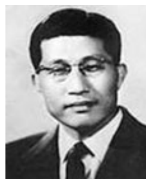
故 유키천 박사(전 서울대 총장, 세계적 형법학자)

저명한 형법학자 고(故) 유키천 박사가 우리 민족이 이스라엘 민족일 가능성이 있다고 <세계혁명>에서 주장하였다. 유 박사는 한국과 이스라엘의 문화와 언어 사이에 나타난 광범위한 공통점 29가지 사례를 기록하였다. 다음은 그 중 대표적인 것이다. 아바(Abba)라는 히브리어와 한글의 아빠(daddy)가 같은 의미이다. 신앙을 신부의 집에 데려가기 위하여 가마가 사용되었다. 삼베옷을 가족의 죽음을 애도하기 위하여 입었다. 그리고 죽음 이후 7일간의 애도기간을 가졌다. 집안에서 신발을 벗고, 도장을 사용하고, 흰옷을 즐겨 입고, 결혼 풍습 중에 중매쟁이가 있다 등이다.